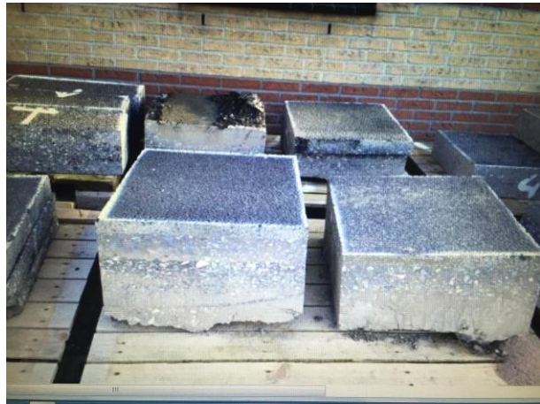
Figuur 2: Foto plaatmateriaal uit de weg

De drie deelnemende laboratoria hebben als opdracht gekregen de rafelingsproeven uit te voeren conform de individuele standaard beproevingsprocedure. Dit geldt niet alleen voor de rafelingsproeven zelf, maar ook voor de toe te passen verouderingsprocedure. Dus op allerlei vlakken verschillen de proeven ten opzichte van elkaar (vorm en afmetingen van het proefstuk, verhouding proefstukoppervlak en belast oppervlak, proefstukoppervlak, belastinggrootte en -tijd, manier om rafeling te meten, beproevingstemperatuur, temperatuurontwikkeling tijdens de proef, ouderdom proefstukken, ...). Uiteindelijk is alleen een vergelijking te maken op basis van de resultaten van de rafelingsproeven. In de volgende paragraaf worden de resultaten van de verschillende proeven gepresenteerd.