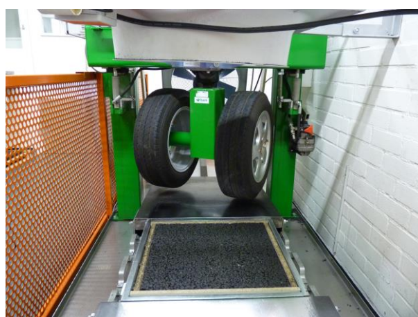
Figuur 1: Foto's van de 3 Nederlandse rafelingsproeven (SR-ITD, RSAT en ARTe)

Een van de belangrijkste eigenschappen van een deklaag is de weerstand tegen rafeling. Om de weerstand tegen rafeling te kunnen bepalen is er een Europese proefnorm geïntroduceerd prTS 12697-50. Deze norm wijkt af van de gebruikelijke naamgeving, omdat het in dit geval een 'Technical Standard (TS)' betreft en géén 'European Standard (EN)'. Het verschil tussen beide normen heeft betrekking op de ervaring met het uitvoeren van de desbetreffende norm: bij een TS-norm wordt de markt uitgedaagd om ervaring met de norm op te doen; bij een